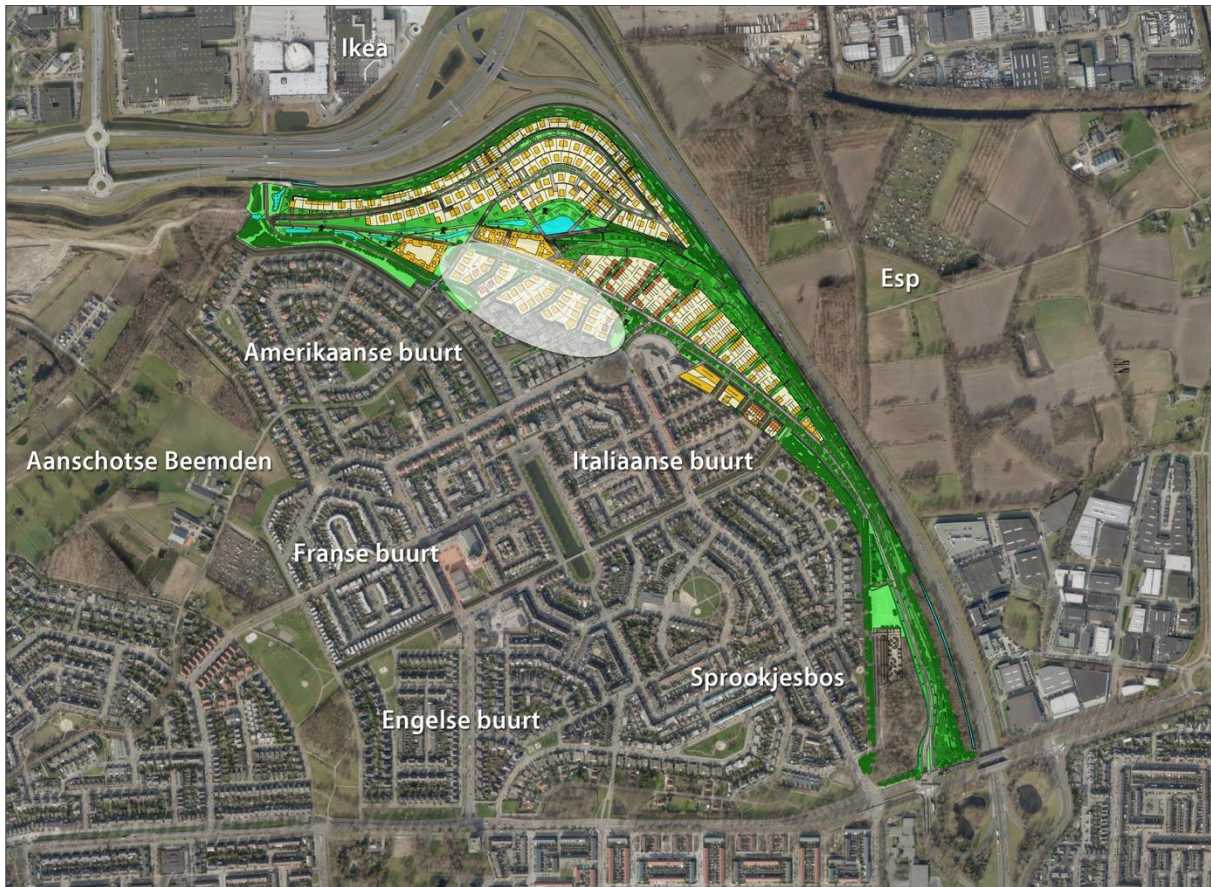
Afbeelding 2: locatie van de 31 vrije kavels in Blixembosch Buiten ten opzichte van de gehele wijk Blixembosch.