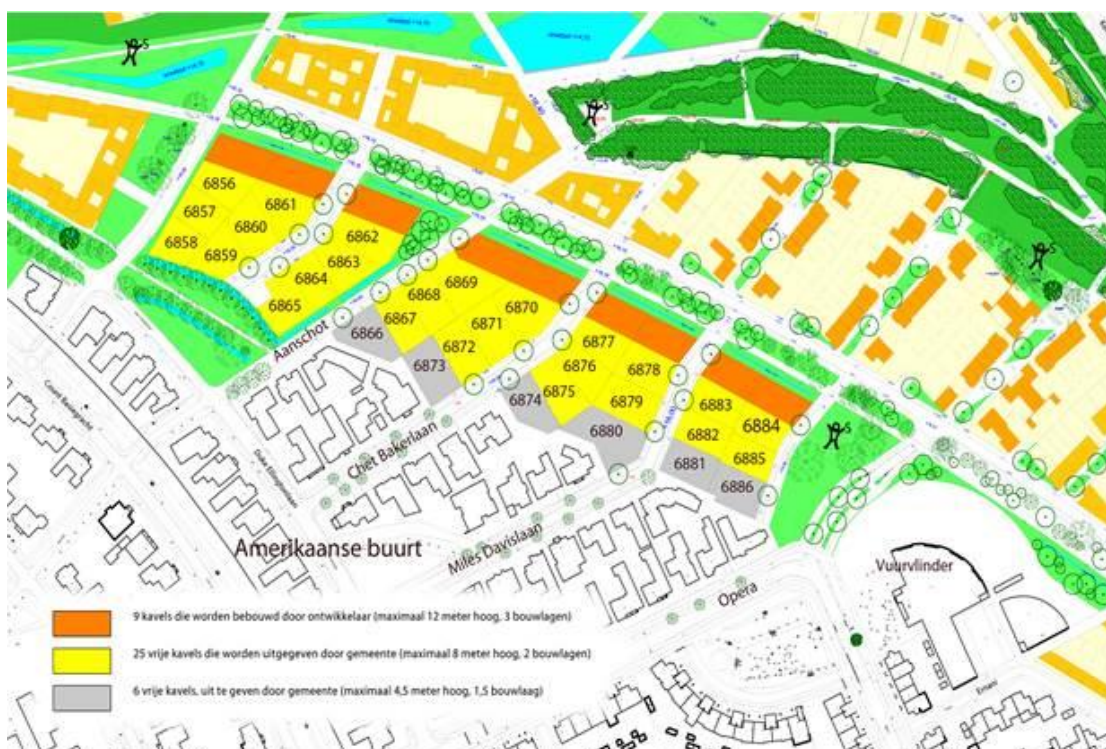
Afbeelding 8: de vrije kavels.

De actuele stand van beschikbare kavels kunt u terugvinden op blixemboschbuiten.nl/zelf-bouwen Meer informatie over het stedenbouwkundig plan en de architectonische verschijningsvorm is te vinden in het beeldkwaliteitsplan voor Blixembosch Buiten. Deze is te vinden op: eindhoven.nl/inwonersplein/bouwen-wonen/Blixembosch-Buiten.htm