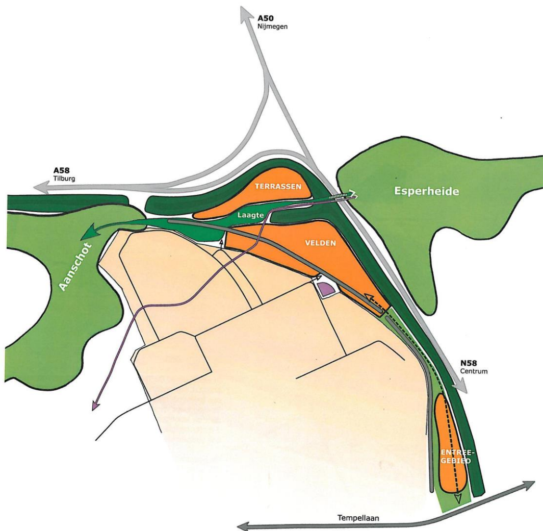
Afbeelding 6: het stedenbouwkundig concept.

De identiteit en het karakter van de nieuwe woonwijk Blixembosch Noordoost worden in sterke mate bepaald door de aanwezige en nieuw aan te leggen geluidwallen. Door de hoogteverschillen te combineren en te integreren met aanwezige boomstructuren ontstaat een gebied met bijzondere kwaliteiten waarin woningen en het openbaar gebied als het ware in geplaatst kunnen worden. Ook omliggende landschappelijke gebieden zoals de Aanschotse Beemden en Esp geven aanleiding tot het creëren van bijzondere woonmilieus. Blixembosch Buiten wordt als het ware omarmd door een groene landschappelijke contour.