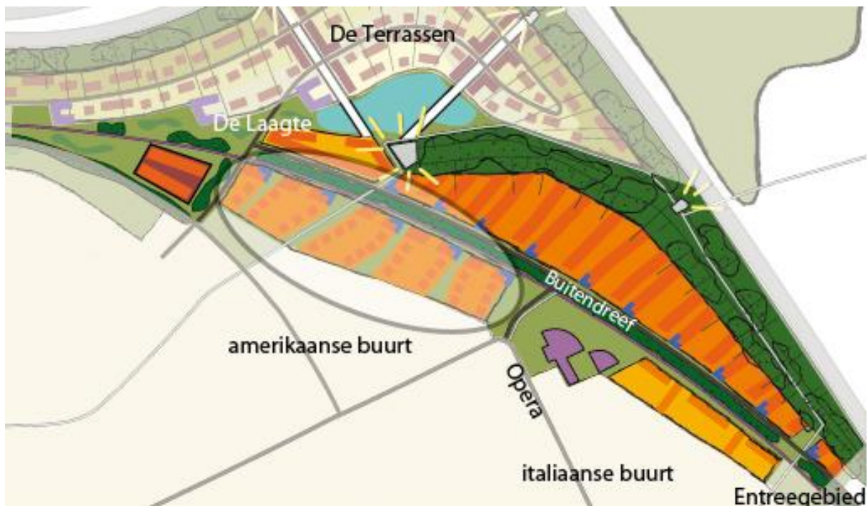
Afbeelding 7: woongebied De Velden van de locatie van de vrije kavels.

De woningen hebben een traditioneel ontwerp met vooral schuine kappen en bakstenen gevels. Korte straatjes met autovrije, groene hoven voor de deur bieden een prettig uitzicht en een veilige woonomgeving, ideaal voor gezinnen met kinderen. Door de verschillende woningtypes en de variaties in het ontwerp ontstaat een speels straatbeeld. Anderzijds zorgt de samenhang in architectuur wel voor eenheid in stijl en sfeer. Parkeren kun je aan de achterzijde van de woningen, veelal op eigen perceel, maar in ieder geval uit het zicht.