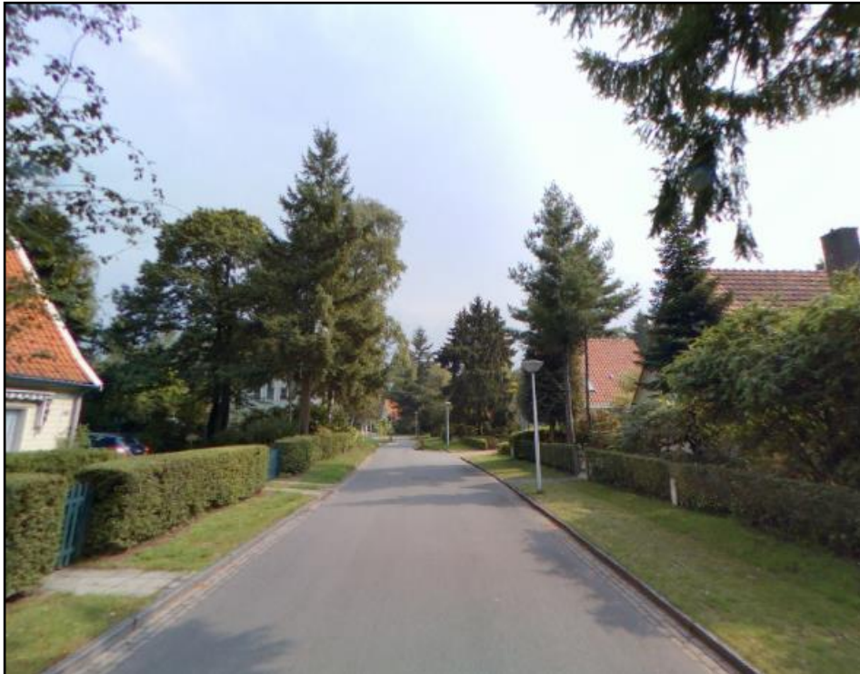
Afbeelding 5: groene tuin- of erfafscheidingen zijn sterk bepalend voor het straatbeeld, zoals hier in de buurt Schuttersbosch in Eindhoven.

De ambitie van de gemeente is om van Blixembosch Buiten een woonbuurt te maken met een landschappelijke uitstraling. Om dit te bereiken wordt er naar gestreefd dat tuin- of erfafscheidingen die grenzen aan de openbare ruimte gerealiseerd worden middels beplanting.