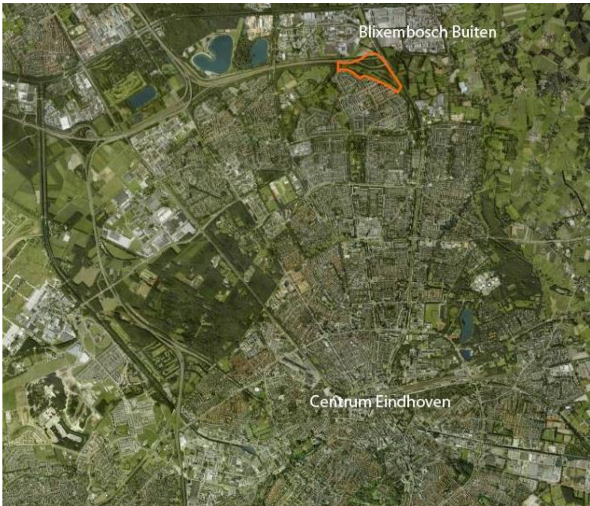
Afbeelding 1: ligging van Blixembosch Buiten in Eindhoven.

Landelijke en recreatieve gebieden zoals Aanschotse Beemden, Aquabest, Esp en Sonse Heide zijn gemakkelijk met de fiets te bereiken. In Blixembosch Buiten komen ongeveer 400 koop- en huurwoningen waarvan 31 woningen gerealiseerd worden op vrije kavels en ongeveer 40 in CPO-verband (Collectief Particulier Opdrachtgeverschap). De overige woningen in Blixembosch Buiten worden de komende jaren projectmatig gebouwd door de ontwikkelaars Hurks vastgoedontwikkeling en BPD (voorheen Bouwfonds).